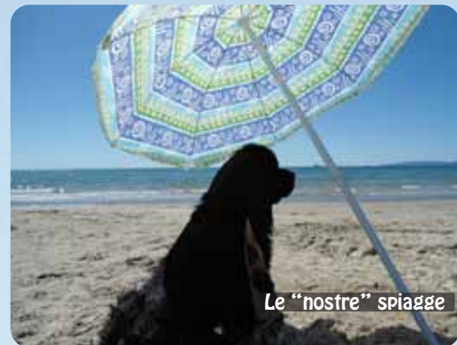
Le "nostre" spiagge