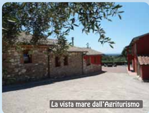
La vista mare dall'Agriturismo