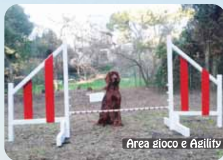
Area gioco e Agility