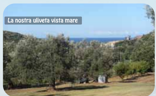
La nostra uliveta vista mare

Possibilità di lezioni con addestratori e/o istruttori.