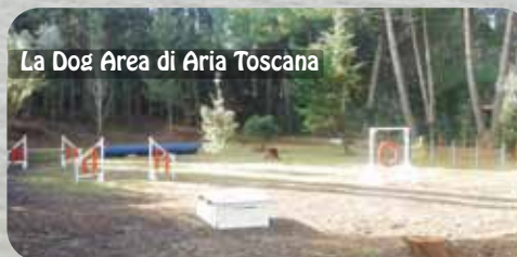
La Dog Area di Aria Toscana

Agriturismo Aria Toscana Campiglia Marittima